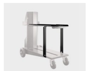
Trolley 54 mit ON TA TR.21