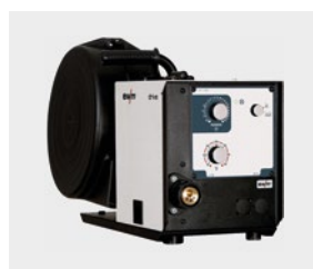
Pico drive 4L