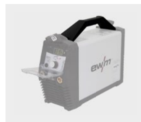
Griff (160 als ON) Pico 350/400 Serie